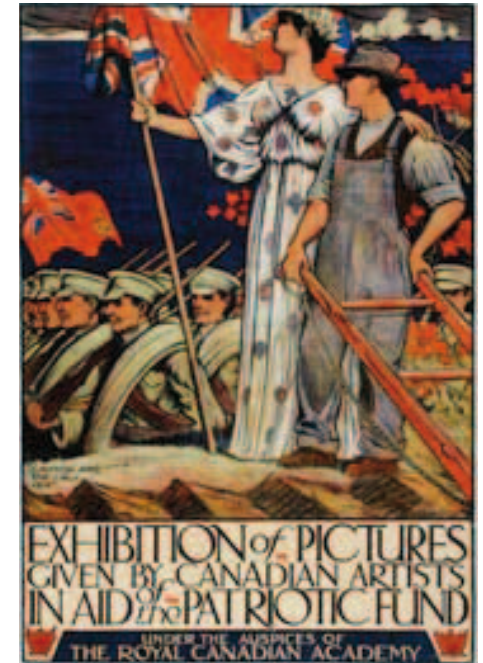
Le Canada (sous les traits de la femme au drapeau) et l'appel. Affiche de J.E.H. MacDonald produite par l'Académie royale du Canada. Musée canadien de la guerre.

À l'image d'une précédente manifestation scientifique organisée autour des mutineries de 1917, le colloque est à la fois centré sur 1914-1918 et ouvert sur des temporalités plus longues et une comparaison avec la Seconde Guerre mondiale. Largement ouvert dans l'espace et dans le temps autour du point de référence de 1914 et composé d'enquêtes bien circonscrites, ce colloque permet de questionner ce qui semble une évidence, au moins en France : la spectaculaire capacité de l'État de prendre en charge, presque du jour au lendemain, une société