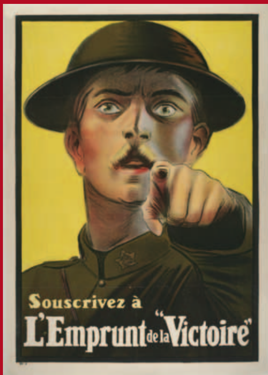
Affiche de propagande canadienne, auteur inconnu. 1917-1918. Musée canadien de la guerre