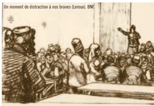
Un moment de distraction à nos braves (Leroux).

Sébastien CHATILLON ( RESEA - Université Lyon 2 )