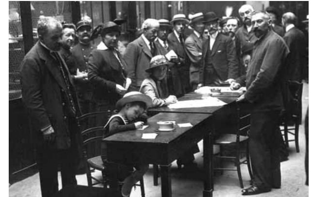
A la Banque de France, le change de l'or contre billets de banque : un enfant confectionne son bulletin. 1915.