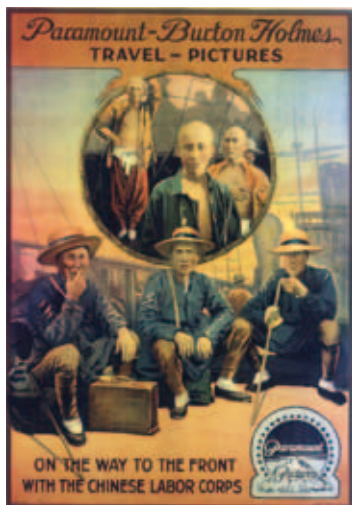
Le chemin vers le front du corps de travailleurs chinois. Affiche. In Flanders Fields Museum, programme Mémoire de la Grande Guerre.

« Mobilisations économiques transnationales et enquêtes industrielles, France et Etats-Unis, 1915-1916 ».