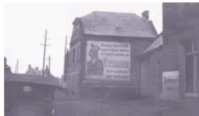
Fresnoy-le-Grand (Aisne). Publicité pour un emprunt de guerre.

« Comment les Parlements sont entrés en guerre. Allemagne et France en comparaison ».